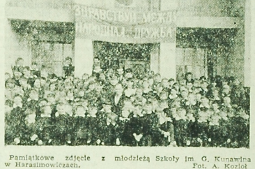
Pamiętnik z zjazdu z młodzieżą Szkoły im. G. Kunawina w Harasimowiczach.