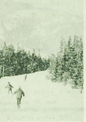
NA ZDJECIU: w górę wylatanie z wód na deskach.

Drugą podstawa grupa wniosków dotyczyła rytmiczności. Ciąg dalszy na str. 4