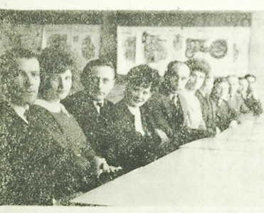
NA ZDJECIU: pracownicy Oddziału Centrali Nasiennej w Monkach...