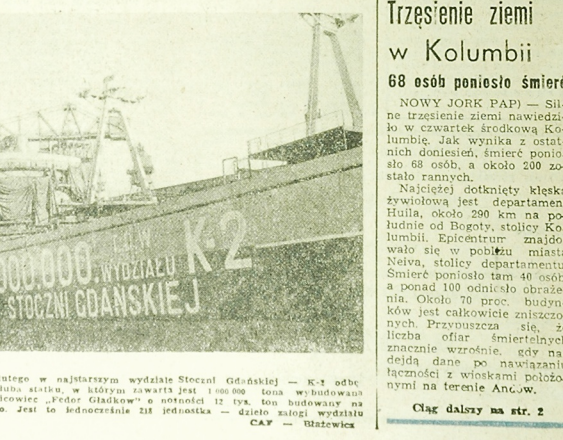
MILIONOWA TONA W dniu 11 lutego w najstarszym wydawnictwie Stoczni Gdńskiej — K-1 odbyła się wodowanie kolejnego kadłuba statku, w którym zawarta jest 1 000 000 tona budowanych przez ten wydział. Jest to drobniaki, jedyną w notowaniu 12 tys. ton budowany na zamówienie armatora radzieckiego. Jest to jednocześnie 21 jednostka — dzieło siłoci wydziału K-2. CAP — Białostok

NOWY JORK (PAP) — Silne trzęsienie ziemi nawiedziło w czwartek stolicę Kolumbii. Jak wynika z ostatnich doniesień, śmierć poniosło 68 osób, a około 200 zostało rannych. Najcięższe dotknięty klęską żywiołową jest departament Huila, około 290 km na południe od Bogoty, stolicy Kolumbii. Epicentrum znajdowało się w pobliżu miasta Neiva, stolicy departamentu. Śmierć poniosło tam 40 osób, a ponad 100 odniosło obrażenia. Około 70 proc. budynków jest całkowicie zniszczonych. Przewidywane, że liczba ofiar śmiertelnych znacznie wzrośnie, nie są jednak dane po nawianianiu łączności z wioskami położonymi na terenie Andów.