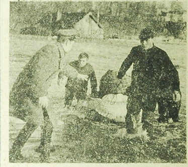
POWÓDZ. W wsi, ostatniśkim wywala rzeka Eyna. Alarm przedpowiody był ogłoszony m. in. w pow. Bartoszyce. Kilka gospodarstw na wiele rodzin codziennie zostało od świata. NA ZDJĘCIU: ratowanie dobytek u gumowym pontonie.