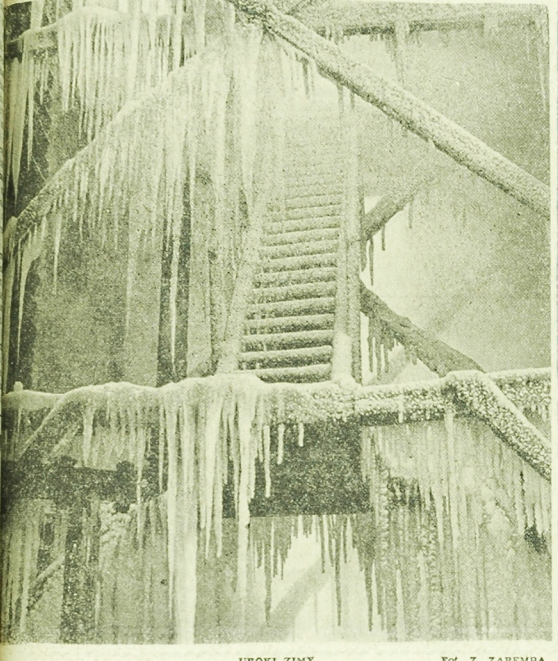
UROKI ZIMY.