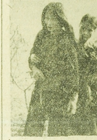
Ciąg dalszy na str. 2

Najlepszym klientem atomistów jest górnictwo. Prawie 40 proc. wszystkich urzędzeń izotopowych tutaj właśnie pracuje, stosowane tej nowoczesnej techniki. W kopalniach stało się polską specjalnością. Urządzenia izotopowe służą do regulacji poziomu węgla w bunkrach, do automatycznego przesławiania zwrotnic torów pod ziemią, automatycznej kontroli umiwienia wózków pod śmiółkami, wreszcie do sygnalizacji pożarów. Dzięki niewielkim, odpornym na trudne warunki podziemnej pracy aparatom, można jest automatyzacja wielu, pracochłonnych operacji, zapobiegania awariom i stratom, podnoszenia bezpieczeństwa pracy górników.