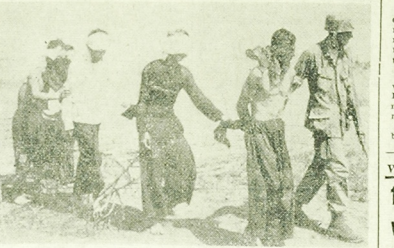
Amerycanie w dalszym ciągu prowadzą operację „Deck House” w delcie Mekongu. Zdaniem donosiłarstwa agencji zachodniej Amerykańskiej nie mogą się jak dotąd pochwalić większymi sukcesami — nie udało im się rozwiązać poważniejszego konfliktu bojowego z partyzantami, natomiast często sami wpadają w zasadki i pokonani — strzelają, kierując się zasadniczo wycofywać się w niedostępne, bagniaste tereny delty.