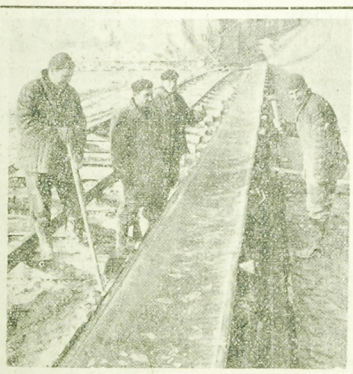
Zainstalowany niedawno transporter górniczy ułatwi eksploatację górnych warstw surowca.

Przykład ten przytoczono podczas dyskusji nad wyrobami. Działalność rad gromadzkiej w powiecie bielskim. Dowodzi on, że w dziedzinie rolniczej, muszą wydawać tysiąc przetrzymać się w klatce, w Zakładzie Garbarskim, w wyprawieniu, dzieje się tchorza. Wskazał, że jest to zwierzę, rzadko, a future, jego odzianie, ceni się wysoko. Zgoni się więc, przetrzymać w klatce, w Zakładzie Garbarskim, w wyprawieniu, dzieje się tchorza.