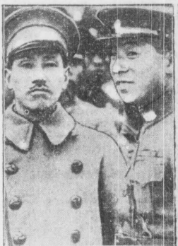
Marszałek chiński Czang-Kai-Szek na lewo, oraz generał Czang-Tsue-Liang.

LONDYN. 15.12. — Tel. wł. — W dniu wczorajszym korespondent pism londyńskich w Pekinie, a zwłaszcza korespondent Reutera, nadesłał telegramy, według których marszałek Czang-Kai-Szek został zwolniony i znajduje się w drodze do Nankinu. Te same niesprawdzone pogłoski donoszą, że p. Sian-Fu wyjechał kontrolować, a jej przywódca gen. Yang-Hu-Czen aresztował marszałka Czang-Tsue-Liana.