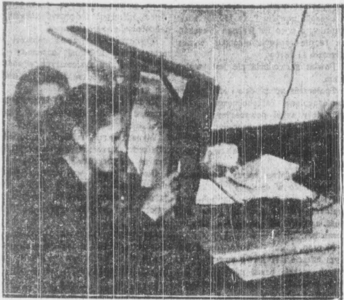
Wprawne oko ogląda stalówkę...