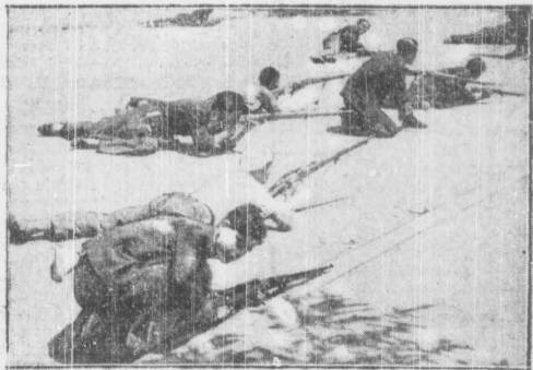
Tyrallera „czerwonych” na ulicach Madrytu