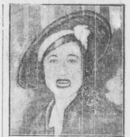
P. Simpson mówi... Typowy układ ust zdradza jej amerykańskie pochodzenie...

Chętnie i obszernie opowiada o tej swej przyjaciółce, która wstąpiła teraz na tron Wielkiej Brytanii.