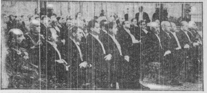
Z okazji 20-lecia działalności Chemicznego Instytutu Badawczego w Warszawie odbyło się uroczyste posiedzenie...