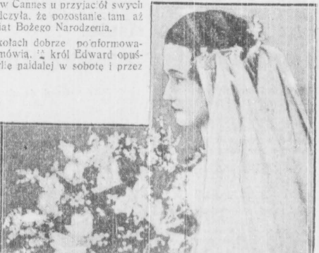
Do ślubu... przed 20 laty, P. Simpson w stroju oblubienicy.

W kolach dobrze poinformowanych mówią, iż król Edward opuści Anglię najdalej w sobotę i przez