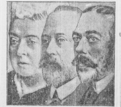
Przed królem Edwardem VIII na tron w angielskim zasiadali: ojciec jego — król Jerzy V, dziad — Edward VII i prababka królowa Wiktorja