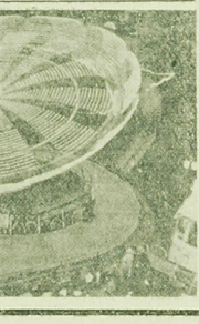
CAF - ADN

Własny maszynowy zakład inicjatywa, na szczeblu tego do człowieka naszych przedsiębiorstw przemysłowych.