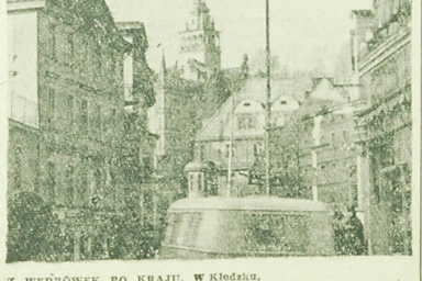
Z WĘDRÓWEK PO KRAJU. W Kłodzku.

Rozpoczął się okres odłowów ryb słodkowodnych. Z 42 tys. ha stawów, należących w większości do Państwowych Gospodarstw Rybackich, a poza tym do PGR-ów i lasów państwowych, odłowionych będzie do końca br. 10 tys. ton ryb. Jednocześnie przewiduje się 12 do roku 1970 odłowów ryb słodkowodnych wznoszących ponad 16 tys. ton rocznie.