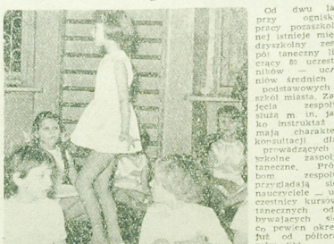
Od dwa lata przy pracy pozostającej istnieć niezdolności... (a)