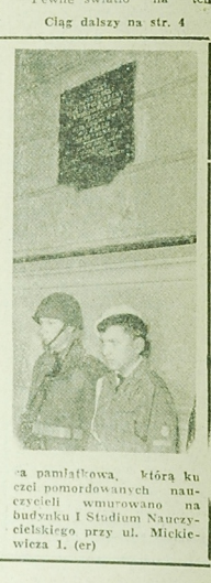
na pamiatkow... ...na pamiatkow... ...na pamiatkow...