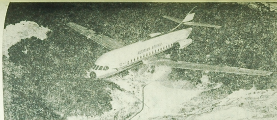
To nie latający model. To nowy typ pasażerskiego samolotu typu „Caravelle” nad Alпами.