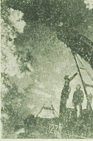
Zwiazek Radziecki dysponuje potężną bronią gwarantującą bezpieczeństwo wszystkim państwom socjalistycznym i gotową w razie zakusy imperializmu. Broń te demonstrowano m. in. podczas defilady z okazji 49 rocznicy Rewolucji Październikowej.

TOKIO (PAP) — W niedzielę w porcie Hongkong doszło do zderzenia statku „Beniawers” z norweskim statkiem „Lilien Bakker”. Na szczęście nie miało ofiar, a zniszczenia ograniczyły się do niewielkie.