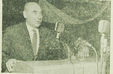
Przemawia członek Biura Politycznego KC PZPR, wicepremier, Franciszek Waniotka.

Omówienie przemówienia wicepremiera Fr. Waniotki na uroczystej sesji KSR w Fastlach