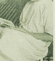
NA ZDJĘCIU: jest już późny wieczór. Zakochany jest obchód. Można usłyszeć sobie spokojnie w kieliku i sięgnąć po podręcznik. (h)

Na naszych zdjęciach młodzi z zajęć internatowych studentów V roku AM w Klinice Polonistycznej i Chorób Kobięcych przy ul. Warszawskiej.