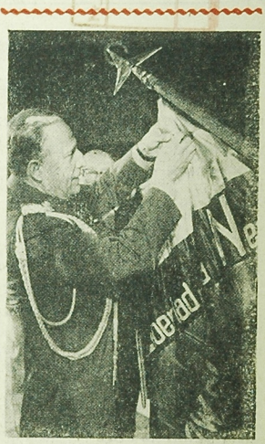
NA ZDJĘCIU: minister Obrony Narodowej, marszałek Polski — Marian Spychalski dekoruje sztab Brygady im. Jarosława Dąbrowskiego Krzyżem Grunwaldu I klasy.

NA ZDJĘCIU: ogólny widok budujących się gmachów nowego centrum radiotelewizyjnego na Służewcu w Warszawie.