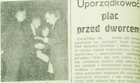
W tym roku nowe mieszkania z budownictwa rady narodowej otrzymało już wielu mieszkańców. Przy ul. Akademickiej i przelokowano do użytku dom o 45 mieszkańach, przy ul. Bohaterów Getta o 38 mieszkańach.

sztof Rau, scenografia Dorota Labanowska, wykonanie Marek Kościuszki i Janusz Piekawski. Jest to program satyryczny, a ponieważ porusza niektóre zakulisowe sprawy lalkarskiej w Polsce, przed spektaklem udzielił dyrektor Państwowego Teatru Lalek „Swierszcza”.