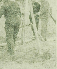
Przygotowywanie placu pod budowę nowego budynku mieszkalnego przy Al. 1-go Maja.

Kolejna wystawa, jaka proponuje nam do obejrzenia Biuro Wystaw Artystycznych i ZPAP w salonie przy Ryku Kościuszki, jest wystawą pejzaży Aleksandra Welsa. Wystawa ta będzie dziś o godz. 10. (a)