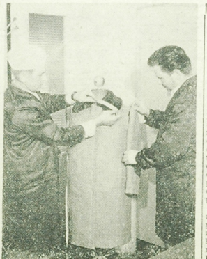
Zima za pasem. Punkty usługowe krawieckie...