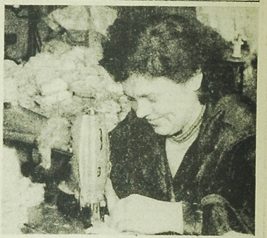
Wła symfonia, umiethelna pani jest pracownia Spółdzielni Wzrostu Kształcenia w Pastach. Widać tu więcej niż w innych zakładach, gdzie pracownicy Spółdzielni Wzrostu Kształcenia w Pastach.

W fabryce urządzeń chłodniczych w Jasztarzewie na Węgrzech ukończono zostały próby praktyczne nowego sposobu lakierowania metali elektroforetycznym. Jest to jedna z najbardziej nowoczesnych metod lakierowania, zapewniająca doskonałą ochronę przed korozją, zapobiegającą uszkodzeniom w skali przemysłowej jeszcze w roku ubiegłym.