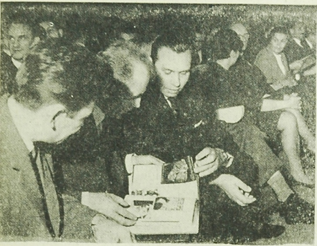
W XXI ROCZNICE UTWORZENIA MO I SB