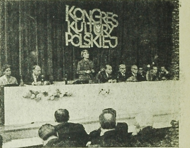
W drugim dniu Kongresu Kultury Polskiej obrady toczyły się w komisjach problemowych. Brał w nich udział najwybitniejsi specjaliści — znawcy zagadnień. NA ZDJĘCIU: obrady Komisji I, która omawiała problem: oświata i nauka podstaw rozwoju kultury. Przewodniczący Komitetu