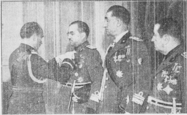
Minister spraw wojskowych gen. Kasprzyski udekorował członków włoskiej delegacji wojskowej... Resnaita wzięliście Krzyżem Zasługi.