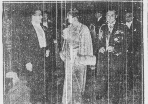
Złot Mussoliniego hr. Ciano (z lewej) na przyjęciu, wydanym przez postać włoskiego w Berlinie...