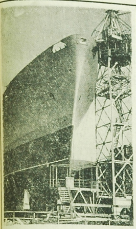
Jak już informowaliśmy, w Stoczni Szczecińskiej im. Adolfa Warskiego zdołano zrealizować nowy typ 10-tysięcznik przeznaczony dla P.L.O. Noszą on nazwę Mięsko I. NA ZDJĘCIU: M/S „Mięsko I” na podłożu „Odra” w Stoczni Szczecińskiej.