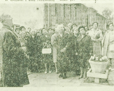
Uczestnicy zjazdu nauczycieli zapoznają się z treścią odsłoniętej tablicy pamiątkowej na gmachu byłego Seminarium Nauczycielskiego.

Po trzydziestu latach od chwili, gdy został wydany ostatni dyplom Seminarium Nauczycielskich w Białymstoku, spotkali się w dniach 24-25 września 1966 r. wykładowcy i wychowankowie. Przyszli tu nie tylko z całego powiatu, ale z różnych stron kraju. W hallach i auli Akademii