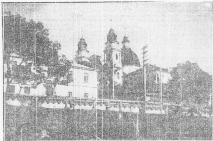
Prastara katedra Mariacka w Chelmie Lub.