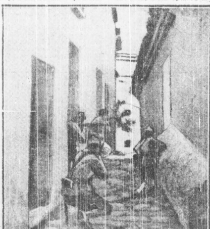
Na przedmieściach Toledo

Czas przywdziać ciepłe ubrania i zaopatrzyć okna.