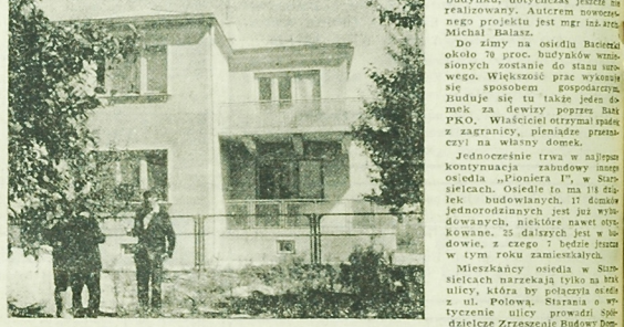
NA ZDJĘCIU: piękny dom to osiedlu w Starostielcach.