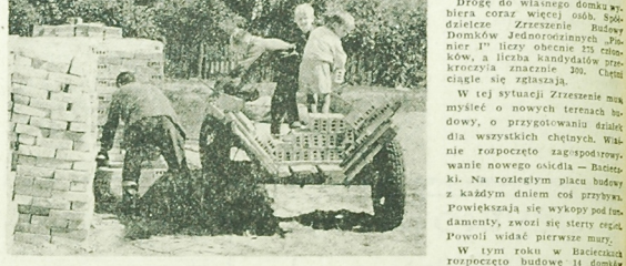
NA ZDJĘCIU: tutaj liczą się każde ręce do pracy.