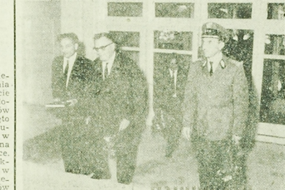
Z dużym zainteresowaniem przedstawiciele władz zwracali uwagę na gmach nowej szkoły.