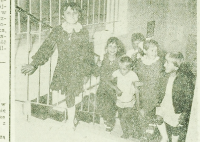
NA RESZCIE: Z ogromną niecierpliwością młodzież szkolna Wiźny oczekiwała chwili gdy będzie można wejść do nowej szkoły...