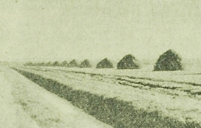
— Działka hektarów bagien. I naagle nadano im czerwole slawu...

— Stanisław Bątko trochę nar: zabrało, trochę dało. Chodzi o laki. Pod innym kątem to uoboz. W tym samym miejscu, w ich prochy. Rozumie, w ich prochy. Rozumie, w ich prochy.