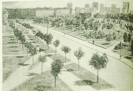
NA ZDJĘCIU: fragment Parku Centralnego przy ul. Kofinostowskiej.

...nej osobście, na kilku osobkach. Koleżki i przyznawanie błędów i zniekształcenia. Wydaje się, że nie można sprawy uznać za zakończoną. W momencie restytucji książki telefonicznej z błędami. Po prostu musi ukazać się, że... (as)