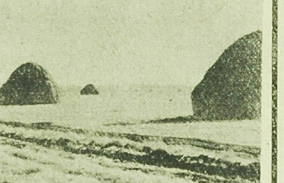
— Ciąg dalszy na str. 4