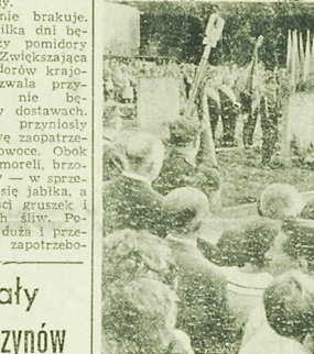
W 22 rocznicę wybuchu Powstania Warszawskiego mieszkańcy Warszawy w setkach miejsc pamiętnych z dnia walk oddali hołd poległym i zamordowanym. Wtenczas złożyli w muzeum Powstańców i Wolności NA ZDĘCIU: składanie wieńców na cmentarzu powstańców warszawskich na Wolf.

wanie rynku. Dotychczas nabywców na jabłka nie było zbyt wielu, gdyż nie wszystkie owoce nadawały się do bezpo. odniej konsumpcji. Obecnie jabłka są już dojrzalsze, a i ceny zachęcają do kupowania. Najdorodniejsze owoce kosztują od 6 do 8 zł. za kilogram, a II wybór jest o połowę tańszy.