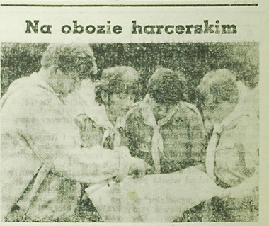
Przed wyruszeniem w teren trzeba pod obłem Komenta obzo - hm. Horawski z Technikom Ekonomizacji...