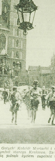
Gotycki Kościół Mariacki i renesansowa Sułkiewicz - to symbol starożytności Krakowa. Zabudowę budowlanego miasta tętni jednak życiem zupełnie współczesnym.

W roku ubiegłym PSK przeleło od kolei przewoży ładunków nie zajmujących całego wagonu, co pozwoliło całkowicie zaozczędzić 100 wagonów towarowych dla innych przesyłek, a także wyczerpać w ciągu roku zapasy pustej przebiegi 12 tys. samochodów różnych inwentarzy.