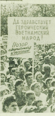
W Związku Radzieckim odbywa się wiec i masowy dla zamianowania żołnierzy ze słuszną walką ludu wietnamskiego amerykańską agresją. Oto fragment masowy, który odbył się w Moskwie w odwetu za zabójstwo.

Wiele z nich doszło do wielkich pożarów, w których zginęło około 1000 osób, a wzięto w niewolę 1000 amerykańskich żołnierzy i grupami