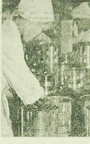
Pracownicy sortują czarne porzeczki do pasteryzacji.

— Czy można przewidzieć się na co ludzie najczęściej oszczędzają?