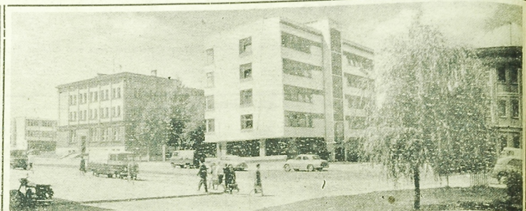
Fragment ul. Dzierżyńskiego.

Niewiele osób wie, co mieści się w starym budynku na Pokoerku przy ul. Kilińskiego. Droga tu znała inwalidki Siedziba to bowiem Wojewódzkiej Poradni Rehabilitacji Zawodowej. Inwalidki, dziającymi przy Wojewódzkim Związku Spółdzielni Inwalidów.