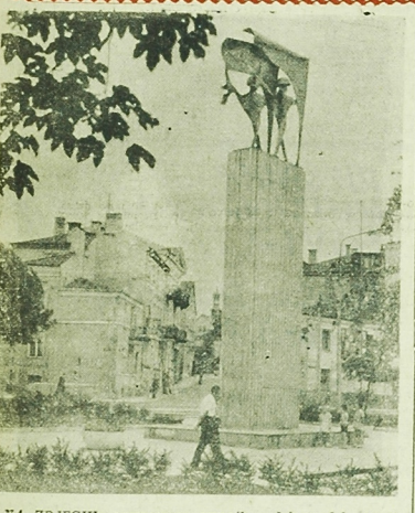
NA ZDJĘCIU: nowoczesny pomnik wdzięczności Armii Czerwonej wśród starych kamieniczek i ulic Chelma.

WARSZAWA (PAP) — W lipcu ludność całego kraju wzrosła o tysiące nowych obiektów, oddawanych do użytku w toku obchodów Święta Odrodzenia. Są to nowe szpitale i ośrodki zdrowia, szkoły i domy kultury, bloki mieszkalne i urządzenia komunalne, ośrodki wypoczynkowe, boiska sportowe i baseny kąpielowe, placówki handlowe i gastronomiczne itp. Do powstania wielu tych obiektów przyczyniły się w dużej mierze „czyny społeczne”.