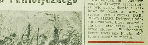
Przebieg uroczystości w Krakowie. W tle: urna z sercem gen. Dąbrowskiego. W pierwszym planie: żołnierze przyznający urnę do transportu. W tle: żołnierze przyznający urnę do transportu. W pierwszym planie: żołnierze przyznający urnę do transportu.

NA ZDJĘCIU: składowa Mo- ców zakładów w Hajnowce.