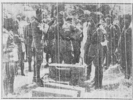
Mussolini wypróbuje nową krótkofalową radiostację wojskową.