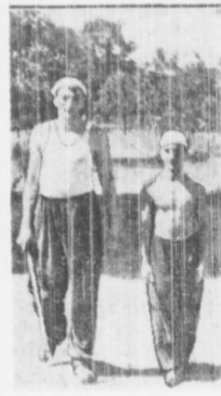
Spacerują po ogrodach C. I. W. F.