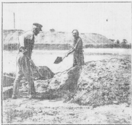
Śląski artysta-malarz nawet na ziemnej robocie nie narzeka na swój los...

ważnie, sumiennie... Nie odrywają głów od zajęcia.