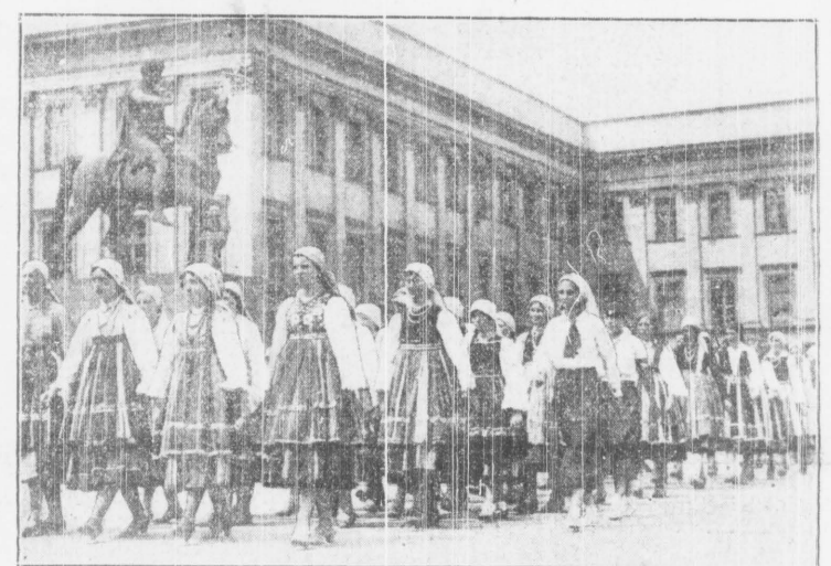
Podczas pierwszego zjazdu młodzieży katolickiej, który obradował w Warszawie, odbyła się w niedzielę na placu Józefa Piłsudskiego dwugodzinna defilada...