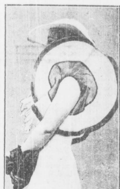
Na przeglądzie ostatnich kreacji w Londynie jedna z artystek wystąpiła w suknie z tekami otó rekawami. Ant lodnie, ani wygodne, lecz wspaniałe, sukni jest z nich zadowolona.

Gra pojedyncza panów: Stenzel — Majewski 7:5, 4:6, 7:5, 7:5. Gra mieszana: Jedrzejska i Hebda — Wiercińska i Kolec 9:7, 6:1, Jacobsenowa i Tarłowski — Pryszczynowa i Kolec II 6:0, 6:3.