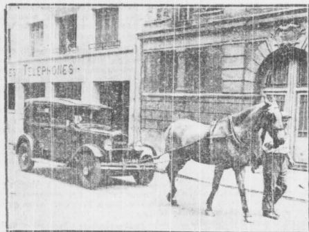
Fala strajkowa, która ogarnęła Paryż, pozabawiła miasto również benzyny i uniemożliwiła dziesiątki tysięcy aut. Oto samochód, zasobiony sprężonym gazem, 'Julowany' przez uzbrojonego konia do garażu. (Ostatnie wiadomości z frontu strajkowego we Francji na str. 2-5).