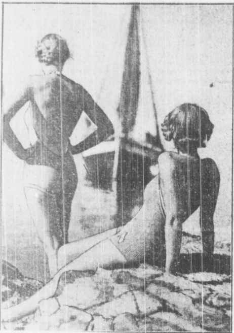
Dokuczające nam od kilku dni deszcze, przeminąć muszą zrókosy i ustąpić miejsca prawdziwemu letu, które pozwoli korzystać z wakacji kąpielnic i słońca.