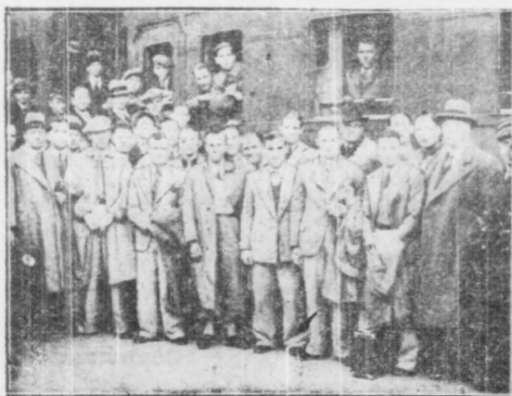
W dniu wczorajszym przybyła do Warszawy angielska drużyna piłki nożnej, Chelsea. Dział drużyna angielska rozegra mecz w Warszawie z reprezentacją Polski na boisku Legii o 3-5-iej pp. - jutro - w Krakowie z Wisłą. Chelsea przyjechała do Polski po dłuższym pełnym zwycięstwie turnieju na kontynencie - z tego względu stanowić może europejski mienik sił naszych piłkarzy. W tabeli angielskiej ligi zawodowej Chelsea zajmuje 10 miejsce.

Wiosłami angielskich - Włosi ponieśli mieli dotkliwie straty.