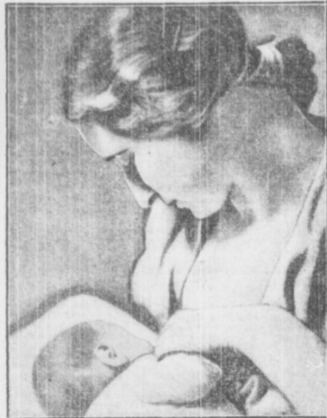
Odcijemy jutro hołd najkochańszym wszystkim Matkom. Niech hołd Córki i Synów będzie pełny i potężny.