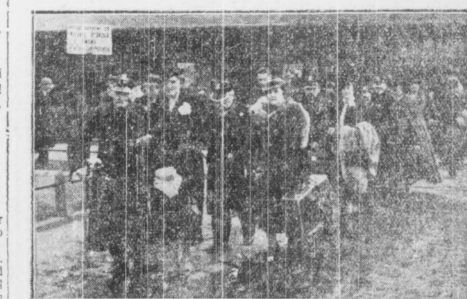
Na uroczystości rocznicy powstania śląskiego wyjechali z Warszawy weterani 1863 r., pod opieką członków Towarzystwa Przyjaciół Weteranów.