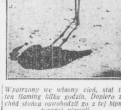
Wsparty wny własny cień, stal jak ten flaming kilka godzin. Dopiero zachodząc słoneczko oświecało go z tej hipnotycznej niewoli.

Na polach p. Sadowskiego w Trzelewnicy pod Naklem natrafiono podczas orki na 3 groby sztyrkowe. W każdym grobie znajdowało się 4-5 ury, dobrze zachowanych.