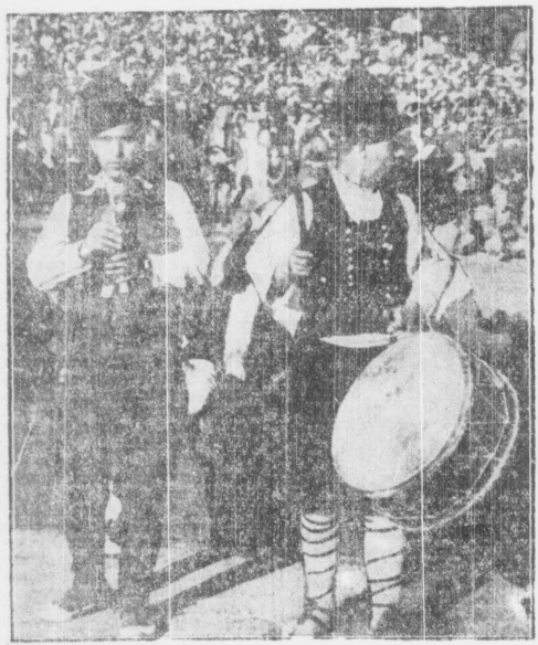
Bulgarzy na festiwalu bałkańskim...