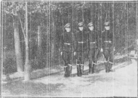
Spotykani żołnierze salutowali wrzemiem emblematy polskości na aście naszego wojska.