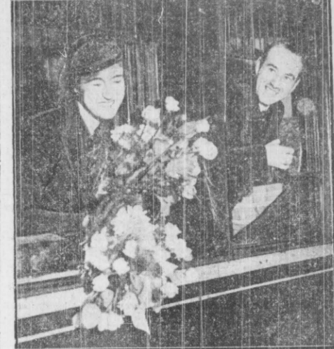
Zdjęcie przedstawia p. premiera Zeelanda z małżonką w chwili odjazdu z Warszawy.