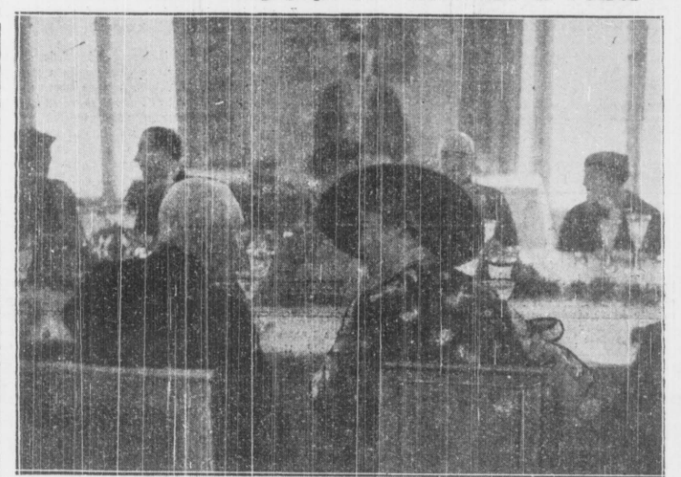
Śniadanie na Zamku. Na pierwszym planie P. Prezydent Rzplitej i pani van Zeeland, w głębi z lewej — premier van Zeeland z prawej — Wódz Naczelny gen. Rydz Smigły.

We wtorek, w ostatnim dniu swego pobytu w stolicy Polski, premier i minister spraw zagranicznych Belgji, o godz. 1-ej po południu przy-