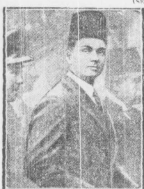
Faruk — nowy król Egiptu

Ma to być symbolicznym nawiązaniem do przastarych tradycji egipskich. (skt).