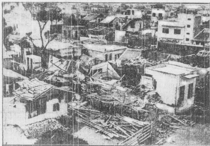
Ostatnie zajęta arabsko - żydowska w Palestynie spowodowały zniszczenie przez Arabów niektórych dzielnic miasta żydowskiego. Oto obraz tego zniszczenia.