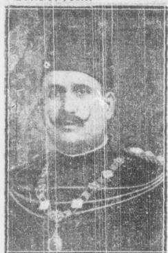
Król egipski Fuad I zmarł dziś o z. 1.30 w pol. w swoim pałacu Kubeh pod Kairem.

Następca tronu, 16-letni ks. Faruk, który dziś rano odleciał z Londynu samolotem do Kairu, nie zastał już ojca swego przy życiu.