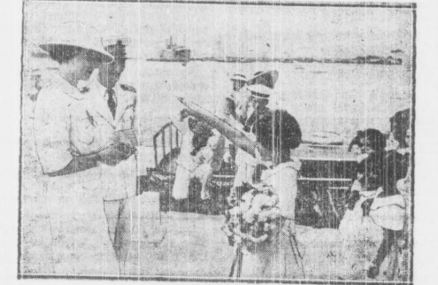
Małe dziewczynki włoskie witały żonę następcy tronu, która przybyła do Atryki