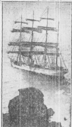
Główne żagle zostały już zdjęte, pozostałe zaś zabrane będą w dniu dzisiejszym.

Wobec tego, że celem seminarjów będzie kształcenie charakterów, kandydaci będą musieli wykazać swą od-