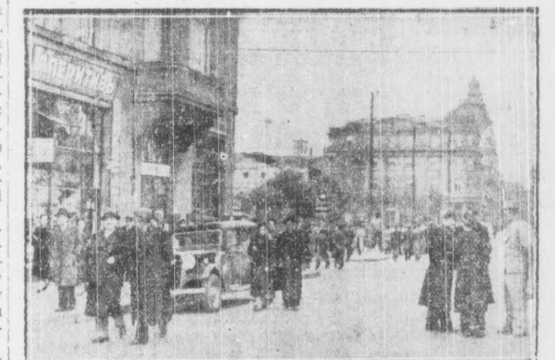
Ulica w Sofii

Ulica w Sofii. Zdjęcie ulicy w Sofii, Bułgaria. Widoczne budynki i ludzie spacerujący.