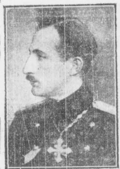
Krół Bułgarii - Borys.