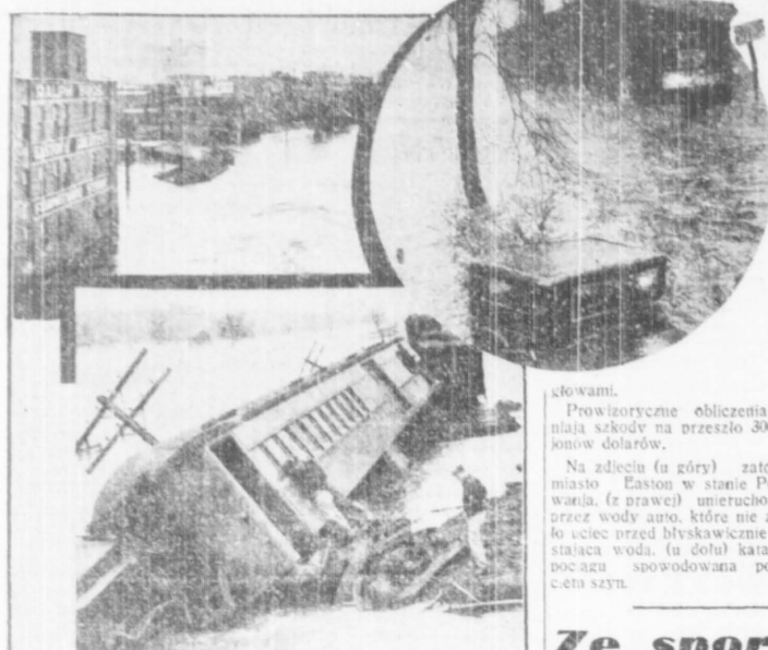
Sroface się do niedawna w Ameryce mrozy ustąpiły miejsca katastrofalnym powodziom.

Około 200 osób zginęło w nurtach webranych wód a 200 tysięcy ludzi zostało bez dachu nad głowami.