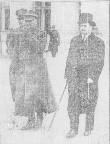
Włod. Naczelny g.n. Rydz-Śmigły i premier Kościalski w towarzystwie w Belwederze.