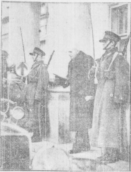
Pan Prezydent Rzeczypospolitej opuszcza Belweder (Na str. 3-iej podajemy pełny tekst przemówienia P. Prezydenta, wygłoszonego przed mikrofonem Polskiego Radia — o wielkości Marszałka Piłsudskiego. Zdjęcie, przedstawiające moment ten z tego przemówienia, zamieszciliśmy w numerze wczorajszym)