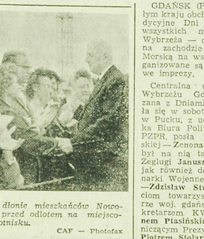
Prezydent de Gaulle kładzie dłoń na głowie mieszkańców Nowosybirsk, żegnających go przed odlotem na miejscowym lotnisku.