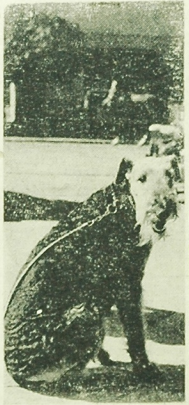
Na toruńskiej wystawie psów rasowych, która odbyła się 12 bm, przy ulicy Waryńskiego w Białymstoku, zdobyła Prima Zaza i Prima Wersa ten sam tytuł. Złoty medal zdobyła Prima Wersa i Białostocka, a srebrny medal zdobyła Prima Zaza i Białostocka. Wśród zdobywców złotych medali na toruńskiej wystawie.

Złote medale zdobyły Prima Zaza i Prima Wersa.