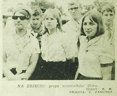
NA ZDJĘCIU: grupa uczestników Złotia.