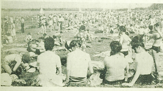
Nasilenie prac w wakacje