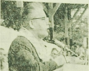
Organizacje mlodziwe dowiodly w praktyce, ze potrafią coraz skuteczniej swiadomosc socjalistyczny stosunek do zycia, pracy i nauki.

Przybliscie na Zlot mlodziezy pracujacej i uczacej sie z miast i wsi wojewodztwa bialostockiego, zrzeszonej w Związku Mlodziy Socjalistycznej, Związku Harcerskiej, Związku Harcerskiego Polskiego, Zrzeszeniu Studentow Polskich i Kolach Mlodziy. Wzrostkowie aby zamianistwowali jednosc mlodego pokolenia, wienosc postepowym i rewolucyjnym tradycjom narodu polskiego, wyrzadz swoje przyzwazanie i gotowosc ofiarnej sluzby naszemu Ojczyźnie - Polsce Ludowej.