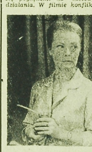
Reżyser filmu „Miejsce dla jednego” — Zygmunt Huber.

Na ile, kiedy i jak dyrektor powinien stosować swoje przepisy, w jaki sposób rozstrzygać konflikty między ludźmi stojącymi u steru? — to pytania, na które w filmie „Miejsce dla jednego” szukać będziemy odpowiedzi.