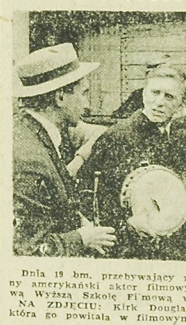
Dnia 19 bm. przebywający w USA amerykański aktor filmowy wysłał Kirka Douglasa, który go powiata w filmowym

Na stawie przy Fabryce Papieru i Celulozy w Kluczkach pod Okuszem zamodowali się kabędz, który ma obrządkie założoną w ogrodzie zoologicznym w Moskwie. Przypuszcza się, że ptak zatrzymał się w Polsce w drodze z ciepłych krajów do macierzystego miasta. Kierownictwo ogrodu zoologicznego w Moskwie zostanie specjalnym pismem zawiadomione o przagarciu jego domownika.