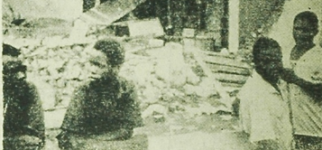
Ponad 100 osób ziemię podczas trzęsienia ziemi, które miało miejsce w zachodniej Ugandzie, w niedzielę 20