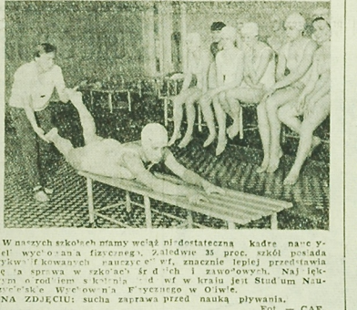
W naszych kolekcjach mamy wciąż ni-dostateczną Kadre nam Y-ciel wycołano...