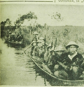
Oddziały partyzantów południowowietnamskich przed atakiem na stacjonariusza bojowe wroga.

W jakich czas później ruchoma brigada policji wygławiła posterunki wokół zniszczonego budynku. W wielu innych częściach miasta studenci szkół wyższych zatrzymywali samochody przebiegające następnie ich opony, demolowali na smach domy i obywateli, przywracając do zdelegalizowania Komunistycznej Partii Indonezji oraz znieuwagiadając ministrów Spraw Zagranicznych Subharto i Osiwaty Sumardjo za ich przekonania postępowe. Oddziały wojskowe wzniosły w czwartek rano dalsze zniszczenia i dymy kolumny dymu wzdłuż dzielnic, w której znajduje się pałac prezydenta Sukarno oraz gmach Ministerstwa Spraw Zagranicznych.