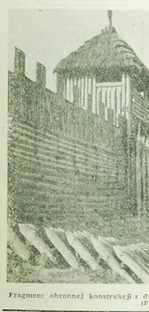
Fragment obronnej konstrukcji z broz w Białostoku.