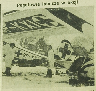
SP-KW... Pogotowie lotnicze w akcji

W tym samym czasie wpłynęło do sądów blisko 41 tys. spraw o alimenty, to jest o ponad 3 tys. więcej w porównaniu z rokiem poprzednim. Blisko 30 tys. wypadków zasądzono alimenty, głównie na rzecz dzieci, od nieopowiadających ojców. Jednocześnie sądownie oddano 3 tys. Tak więc coraz więcej rodzin żyje w trudnych warunkach. W tym samym czasie wpłynęło do sądów blisko 41 tys. spraw o alimenty, to jest o ponad 3 tys. więcej w porównaniu z rokiem poprzednim. Blisko 30 tys. wypadków zasądzono alimenty, głównie na rzecz dzieci, od nieopowiadających ojców. Jednocześnie sądownie oddano 3 tys. Tak więc coraz więcej rodzin żyje w trudnych warunkach.