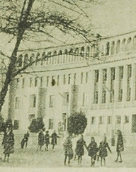
Dzisiaj w stolicy Urduńskiej Republiki Radzieckiej - Taszkencie, odbędzie się spotkanie prezydenta Pakistanu, Ayyub Khana i premiera Indii Lal Bahadur Shastri. NA ZDJĘCIU: pałac pracowników przemysłu włókienniczego w Taszkencie - tutaj odbędą się rozmowy między Khanem i Shastriem.