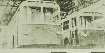
Trolejbusy stanowią jeden z głównych środków komunikacji w Związku Radzieckim — ekonomiczne, niezgorzone i nie zużywające miejscowego powietrza spalania.

W naszej sytuacji właśnie stypendia fundowane są najskuteczniejszą formą angażowania fachowców.