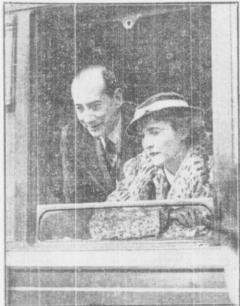
Zdjęcie nasze przedstawia moment wyjazdu ministra spraw zagranicznych J. Becka w towarzystwie małżonki do Londynu...