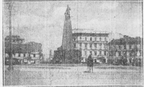
Plac Kościuszki w Łodzi.