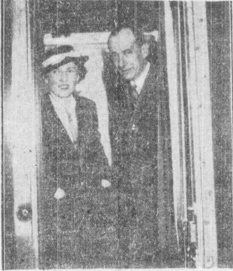
Minister Beck z małżonką w drzwiach wagonu na chwilę przed ruszeniem pociągu.

Niezależnie od tego między min. Beckem a premierem van Zeelandem nastąpi wymiana poglądów na współpracę w dziedzinie stosunków międzynarodowych.