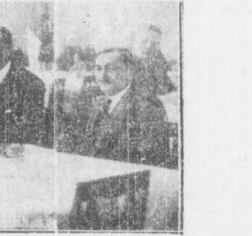
Sejm rozpoczął w poniedziałek debatę budżetową, zahangrowaną wielką mową programową P. Premiera M. Zym-dram-Kosiłkowskiego. Na str. 2-jej podajemy sprawozdanie z wczorajszego dnia obrad.