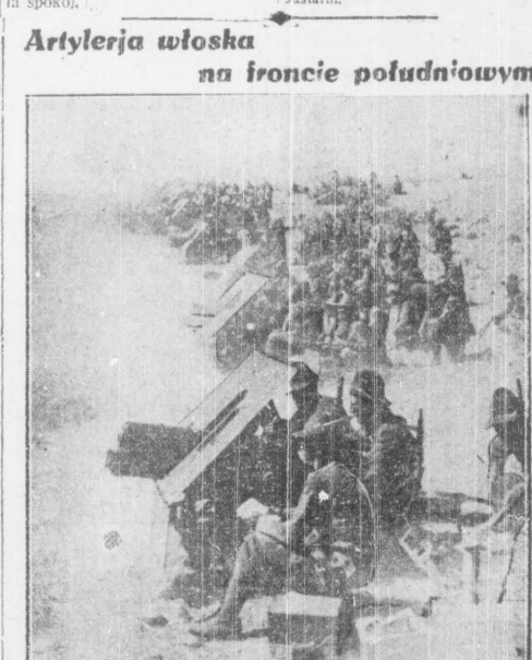
Oddział artylerji górskiej z armji gen. Graziani'ego ostrzeliwuje na froncie południowym po stronie abisjyńskiej.